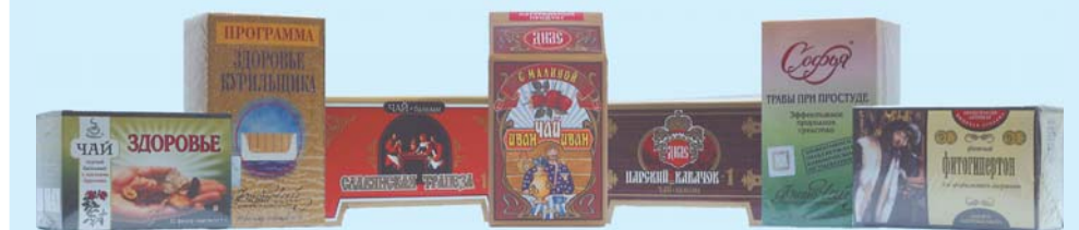
Слева направо: «Гольфстрим - Здоровье», «Здоровье курильщика», «Славянская трапеза 1», «Иван-чай-иван с малиной», «Царский кабачок», «Софья - Травы при простуде», «Фитогипертон».