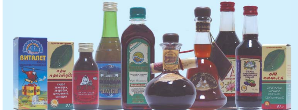
Слева направо: «Виталет», «При простуде», «Сироп от кашля иммуностимулирующий», «Эмби - печеночный», «Гербамарин - общеукрепляющий», «Золотая сибирь», «Золотая розга», «Сироп зеленого чая с суданской розой», «Сироп боярышника с черноплодной рябиной», «От кашля».

разнообразие витаминных препаратов. В некоторых из них насчитывается более 10 витаминов, минералов и аминокислот. Имеются препараты, которые полезны при нерегулярном, недостаточном и однообразном питании, при потере организмом минералов. При применении мультивитаминных препаратов, очень важен учет индивидуальных особенностей человека, в частности пол, возраст, вес, наличие хронических заболеваний. Женщинам среднего возраста необходимы препараты, включающие соли железа, пантотан кальция. Для сохранения здоровья кожи рекомендуется комплекс витаминов В и бета-каротин. Сохранению структуры волос помогает применение витамина А, пантотената кальция, фолиевой кислоты.