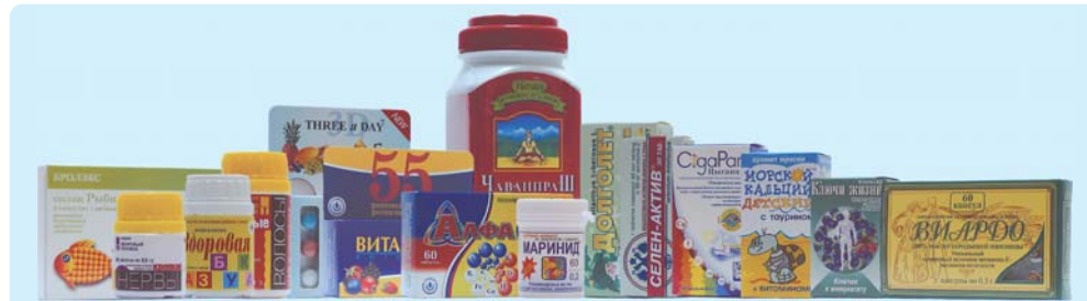
Слева направо: «Рыбий жир», «Крепкие нервы», «Здоровая азбука», «Крепкие волосы», «Three a day», «Витаминерал», «Алфавит», «Чаванпраш плюс», «Маринид», «Долголет», «Селен-актив», «Цыганан», «Морской кальций», «Ключи жизни», «Виардо».